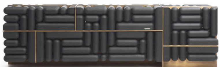
Sideboard mit markanter Außenhaut, gegliedert durch ein Messingskelett