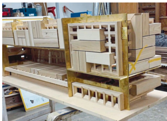
Das Mosaikwerk als Außenfläche verlangte ein sehr strukturiertes Arbeiten, damit die Fräsarbeiten effektiv durchführbar waren