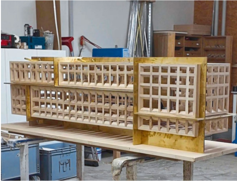
Die Möbelkorpuselemente sind als Rahmenwerk aus diagonal gefrästen Eschenleisten aufgebaut, die dann die rund gefrästen Schüblinge aufnehmen