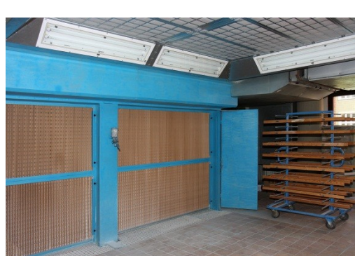
Der neue Spritzraum

Das Innenleben des Schaltschranks wurde dem neuesten Stand der Technik und den Bestimmungen der aktuellen Unfallverhütungsvorschriften angepasst. Nun kann unter besten Bedingungen lackiert werden. Der komplette Umbau kostete etwa 28.000 €.