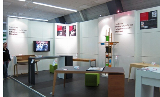
links: Blick auf den Messestand

Informationen zu CAD- und Branchenprogrammen, Wissenswertes über die Meisterausbildung im Schreinerhandwerk und Meisterstücke, die aus nächster Nähe erleben werden konnten: Technik traf auf Anwendung und Möbelästhetik. Eine Kombination, die gerade junge Schreiner anspricht, die Zielgruppe der msm .