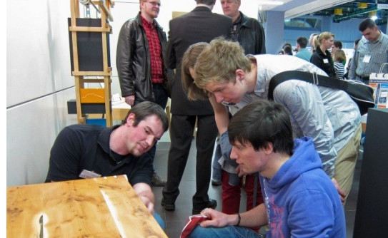
rechts: meisterlich bis in die Details