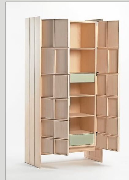
OFFEN ZEIGT SICH DER SCHWEBENDE SCHRANK MIT VIELEN DETAILS.