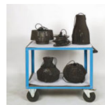
Fünf verschiedene Pendelleuchten in schwarzer MDF, gefertigt mit der Shaper Origin

LEUCHTEN AUS HOLZ und Holzwerkstoffen sind dem Schreinerhandwerk nahe. Gleichzeitig sind sie konstruktiv und formal weit genug von einem Möbel entfernt, um unbefangen, unkonventionell und mutig an eine Entwurfsaufgabe heranzugehen! Es ging bei diesem Projekt vordergründig um Pendelleuchten, ihre Entwicklung im Team und die Fertigung mit der Shaper Origin. Fast mehr noch aber um Wachheit im Prozess, um Kommunikation und Dokumentation.