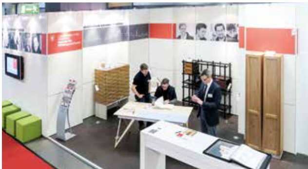
Oben: Das Aufbauteam der Meisterschule bei der Arbeit. Gut zu erkennen: die Hängeleisten für die weiß lackierten Felder. Darunter: Der fertige Messestand mit vier ausgewählten Meisterstücken.