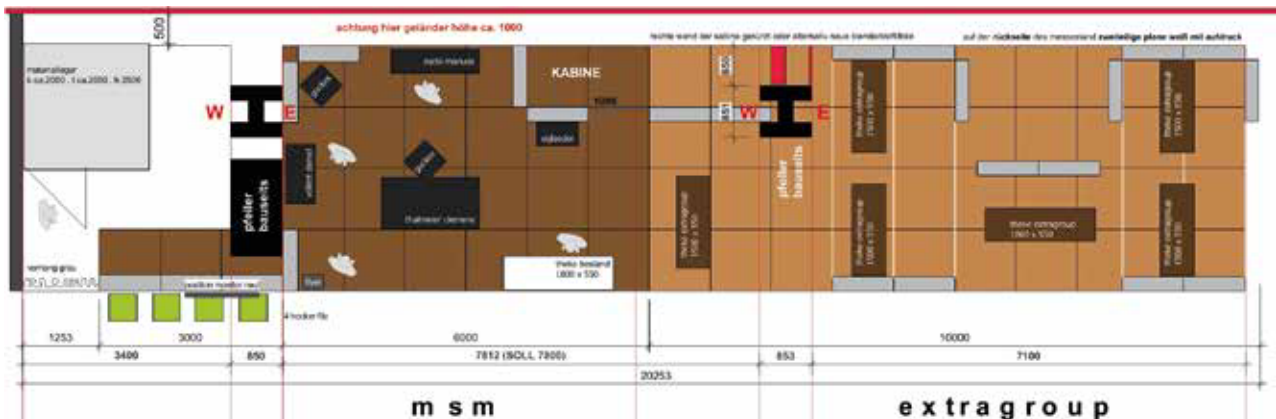
Unten: Grundriss des Messestands der Meisterschule und der Firma Extragroup. Der vorhandene Stand musste neu aufgeteilt werden um die Stützpfiler des Messegebäudes zu integrieren.